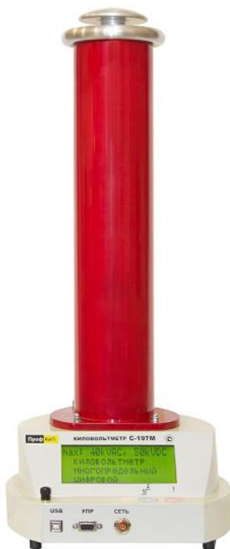
Рис 1. Внешний вид киловольтметра «ПрофКиП С197М».

Внешний вид киловольтметра приведен на рис. 1.